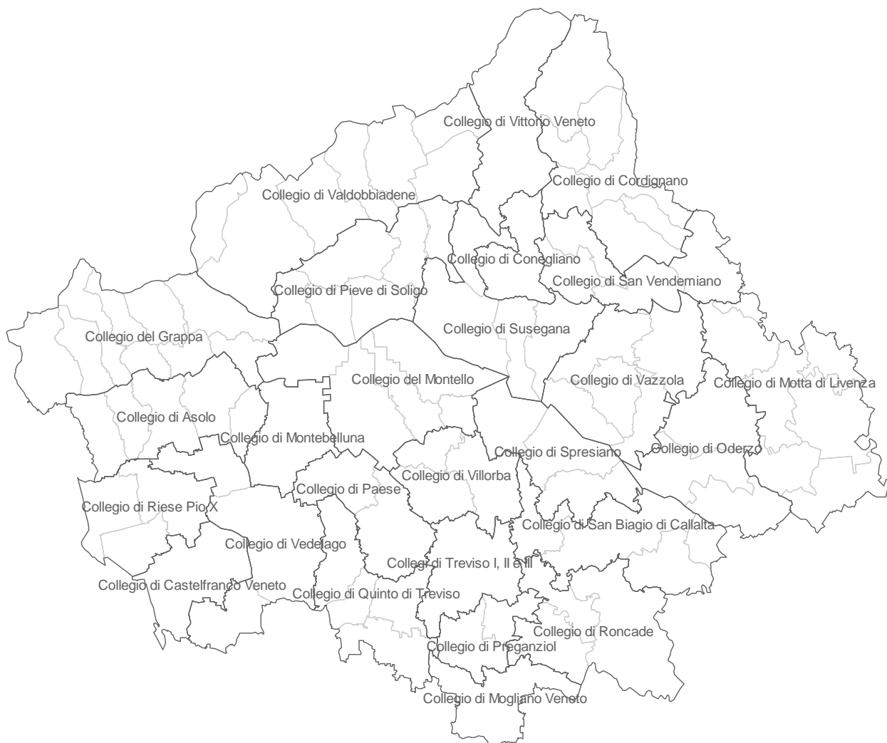
Figura 1. Provincia di Treviso: mappatura dei nuovi collegi uninominali per le elezioni provinciali 2011

Il seguente report mostra la mappatura dei nuovi collegi uninominali della Provincia di Treviso, chiamata al voto per le elezioni provinciali 2011, e l'elenco dei comuni che li compongono. La tabella 2 riporta il trend elettorale 2005-2010 della Provincia di Treviso. Infine, le tabelle 3 e 4 contengono i risultati delle liste regionali e provinciali alle elezioni regionali 2010 calcolati sulla base dei nuovi collegi provinciali.